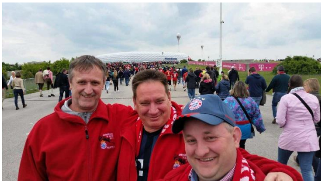
Auf dem Weg ins „Wohnzimmer“! Meisterfeier, Freibier und jede Menge Spaß standen bevor.