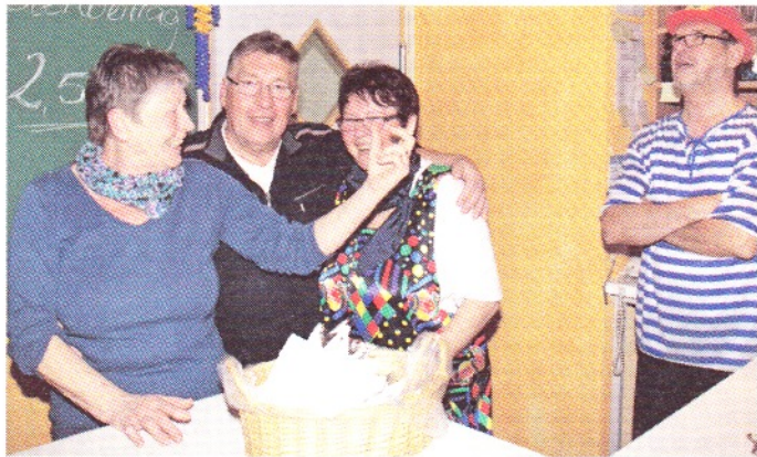
Auch die Helfer hatten ihren Spaß

Ihnen allen also auch an dieser Stelle nochmals vielen, vielen Dank! Unser Dank gebührt selbstredend auch den zahlreichen Damen und Herren, die immer wieder leckere Kuchen, Torten, Berliner, Windbeutel und Ähnliches spenden. Herzlichen Dank (und weiter so!) Sicher wird noch lange von diesem tollen Nachmittag die Rede sein.