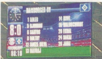
Deutlicher geht es kaum!

... hatten die Fußball- und vor allem die FC-Bayern-Fans getroffen, die am Fastnachtssamstag in unseren Bus nach München eingestiegen sind. Während in Philippsburg närrisch gefeiert wurde, erlebten wir ein nicht weniger närrisches Fußballspiel in der Allianz Arena. Fast ungläubig verfolgten wir 90 stimmungsvolle Minuten mit Powerfußball des deutschen Rekordmeisters. Und das Sahnehäubchen, beim 8:0 gegen den HSV, servierten uns die HSV-Fans mit viel Humor und Selbstironie. Fangesänge-Chronologie: 6:0 = „Zieht den Bayern die Lederhosen aus“; 7:0 = „Auswärtssieg“, Auswärtssieg“; 8:0 = „Deutscher Meister wird nur der HSV“ – mit Respekt und vor allem fair wurde die Niederlage des HSV von dessen Fans ertragen.