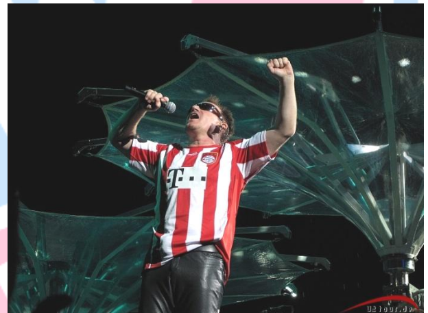
Sänger Bono gab im Trikot von Bastian Schweinsteiger seine Zugabe. Die Menge tobte als er den 2:0 Sieg der Bayern gegen AS Rom bekannt gab.

Kilometer weiter eine besondere Ehre zuteil. Die irische Rockband U2, die zeitgleich zum Champions-League-Spiel der Bayern gegen den AS Rom im Olympiastadion auftrat, huldigte in Person von Leadsänger Bono dem Mittelfeldspieler der Bayern. Es war kurz nach 22.30 Uhr, als U2 die Bühne vor 75.000 Zuschauern noch einmal für die Zugaben betraten. Bono gab sich dabei als Hobby-Sportreporter aus und verriet das Endergebnis aus der Allianz Arena. "Bayern two, Roma zero" , hauchte der 50-Jährige ins Mikrofon und sorgte für