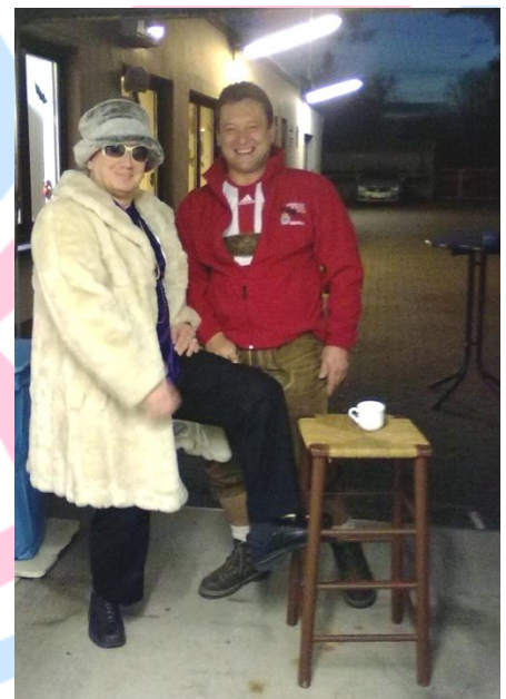
Im Außenbereich wurde trotz milder Temperaturen Glühwein und hochprozentiges serviert.