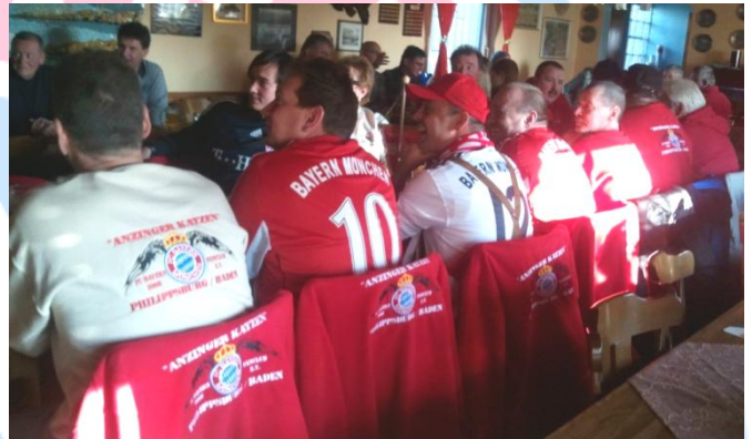
Volles „Haus“ beim ASV Rheinhausen. Der Fanclub war mit über 25 Personen angereist und konnte dort seinen ersten Sieg des FCB feiern.

Der FC Bayern rundete mit einem 3 : 1 Auswärtserfolg in Bremen einen gelungenen Tag ab und beförderte die Bremer weiter in die Krise und noch tiefer in den Tabellenkeller. Somit konnte der Fanclub auch seinen ersten Sieg in den Räumen des ASV feiern, eine Negativ-Serie konnte jetzt endlich beendet werden.