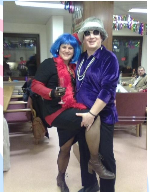
Ein dritter Platz sprang für den 1. Vorsitzenden des Fanclubs heraus. War die Jury bestochen?

Der Besitzer dankt dem ehrlichen Finder an dieser Stelle sehr herzlich.