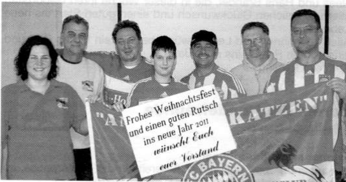
Die besten Wünsche des Vorstandes

Der Vorstand würde sich freuen, im neuen Jahr wieder alle gesund, zahlreich und gut gelaunt zu den ersten Vereinstermi- nen begrüßen zu dürfen.