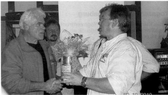
Sieger des „Wettnageln“

Ein weiterer Dank geht auch an die Metzgerei Oberst sowie an Globus Warenhaus, für die Bereicherung der Tombola. Man möchte sich an dieser Stelle auch für die bisher getätigten Spenden herzlich bedanken und ein ganz großes Dankeschön nach München, zum FC Bayern schicken. Wie bereits im Vorjahr hat der FC Bayern maßgeblich dazu beigetragen, dass diese Verlosung für den guten Zweck in dieser Form durchgeführt werden konnte. Mit tollen Sachpreisen hat der FCB den Großteil der Tombola-Gewinne zur Verfügung gestellt.