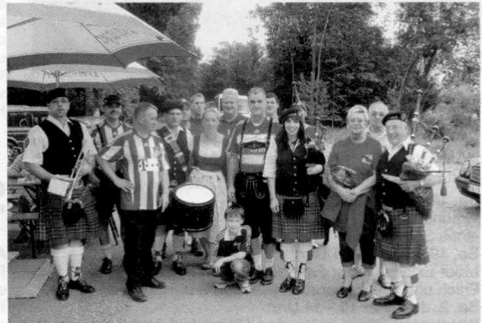
Die Strasser Garde spielte für den Club

Der Bayern Fanclub „Anzinger Katzen“ feierte das Saisonfinale gleich doppelt. Die meisten Clubmitglieder, gezählt wurden erneut weit über dreißig, waren zu Gast beim ASV Rheinhausen.