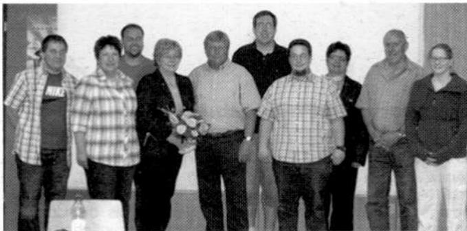
Die neue Vorstandschaft