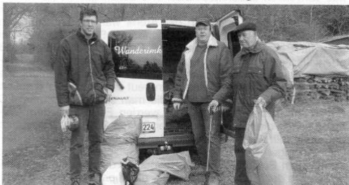
Einige fleißige Vereinsmitglieder mit ihrer „Beute“ bei der Gemarkungsputzete in Kirrlach

Einladung zur Mitgliederhauptversammlung des Bezirksimkervereins Philippsburg am Freitag, den 26. März 2010 um 19:30 Uhr in der TSV-Gaststätte in Wiesental. Unter anderem berichtet der Schriftführer über das abgelaufene Jahr, es wird vom badischen Imkertag berichtet und es besteht die Möglichkeit, Oxovar und Ameisensäure zu bestellen. Als Highlight wird ein Film von Helmut Westenfelder gezeigt: Mythos Amazonien. Alle Mitglieder und Interessierte sind herzlich eingeladen.