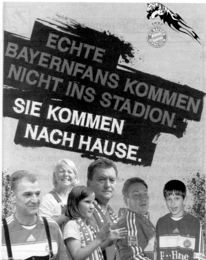
Vorfreude auf die kommende Saison