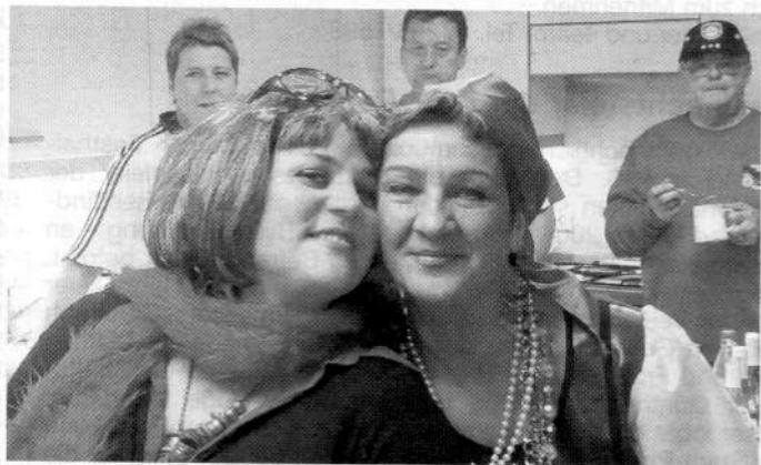
Närrische Eröffnung der Vereinsräume

Nachdem eine Abordnung des Fanclubs beim Neujahrsempfang der Stadt Philippsburg zu Gast war, stand Tags darauf bereits ein weiterer Termin für einige Mitglieder an. Der Fanclub hatte die Bewirtung der närrischen Eröffnungsfeier der neuen Vereinsräume der Philippsburger „Geese“ übernommen. Mit einigen Helfern war man bis weit nach Mitternacht im Einsatz und verbrachte einen lustigen Abend mit einer bunten Narrenschar, die ausgelassen in ihren neuen Vereinsräumen feierte.